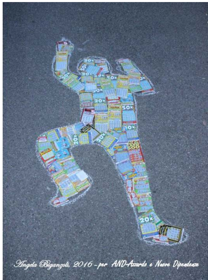
Angela Biganzoli, 2016 - per AND-Azzardo e Nuove Dipendenze