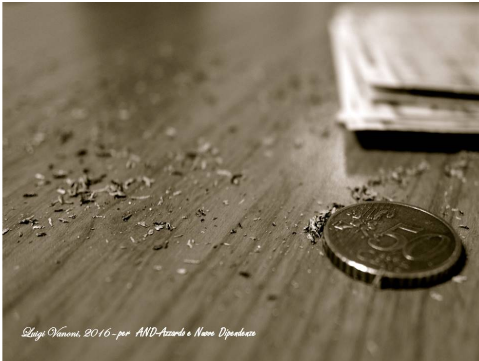
Luigi Vanoni, 2016 - per AND-Azzardo e Nuove Dipendenze